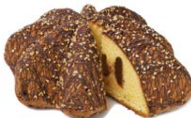
Cuor di Pandoro® Crema Gianduia Impasto farcito con crema al gianduia, ricoperto di cioccolato fondente e granella di nocciole.