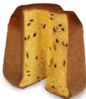
Pandoro Gocce Cioccolato Fondente 70% Impasto fior di burro e gocce di cioccolato e bustina di cacao amaro.