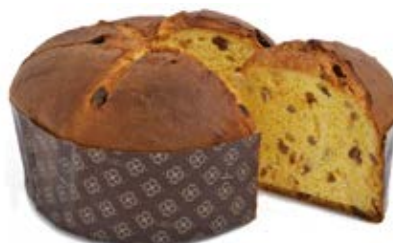
Panettone Classico Basso (gold)