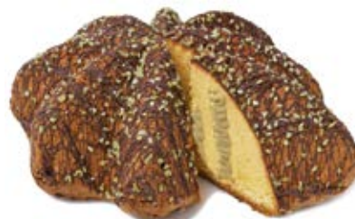
Cuor di Pandoro® Crema Pistacchio Impasto fior di burro, farcito con crema al "Pistacchio verde di Bronte DOP", ricoperto di cioccolato fondente e granella di "Pistacchio verde di Bronte DOP"