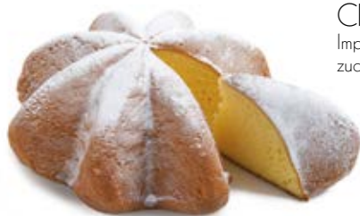
Cuor di Pandoro® Classico Impasto fior di burro e bustina di zucchero a velo.