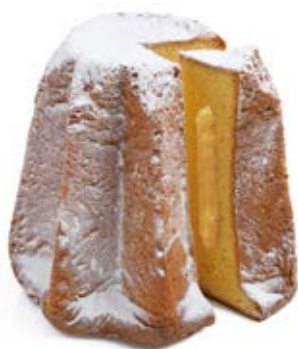
Pandoro Crema Limoncello Impasto farcito con crema limoncello e bustina di zucchero a velo.