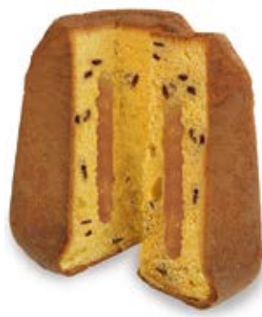
Pandoro Crema Tiramisù e Gocce di Cioccolato al Caffè Impasto con gocce di cioccolato al caffè, farcito con crema al tiramisù e bustina di cacao amaro.