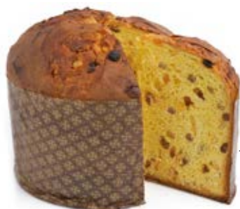
Panettone Classico Alto