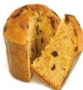
Panettoncino Pere e Cioccolato Impasto con cubetto di pera e gocce di cioccolato.