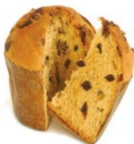
Panettoncino Gocce di Cioccolato Impasto con gocce di cioccolato.