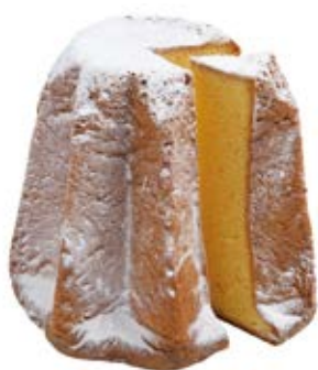
Pandoro Classico Impasto fior di burro e bustina di zucchero a velo.