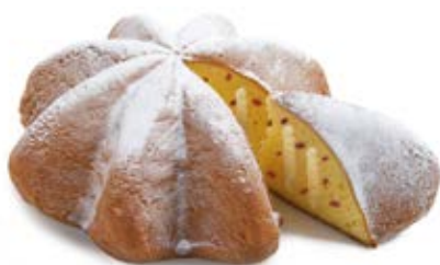
Cuor di Pandoro® Crema Mascarpone e Frutti di Bosco Impasto fior di burro, farcito con crema mascarpone e frutti di bosco semicanditi e bustina di zucchero a velo.