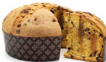
Panettone Crema Tiramisù

Impasto con gocce di cioccolato al caffè, farcito con crema al tiramisù.