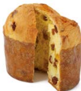
Panettoncino Classico Impasto con uvetta e arancia candita.