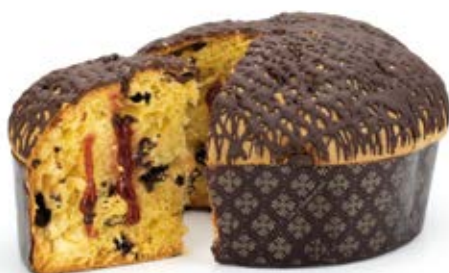
Panettone Crema Amarena e Gocce di Cioccolato

Impasto con gocce di cioccolato, farcito con crema amarena, ricoperto di cioccolato fondente.