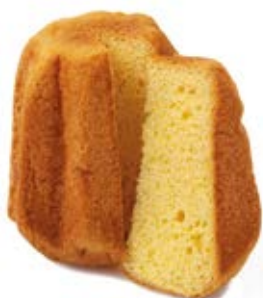
Pandorino Classico Impasto fior di burro.